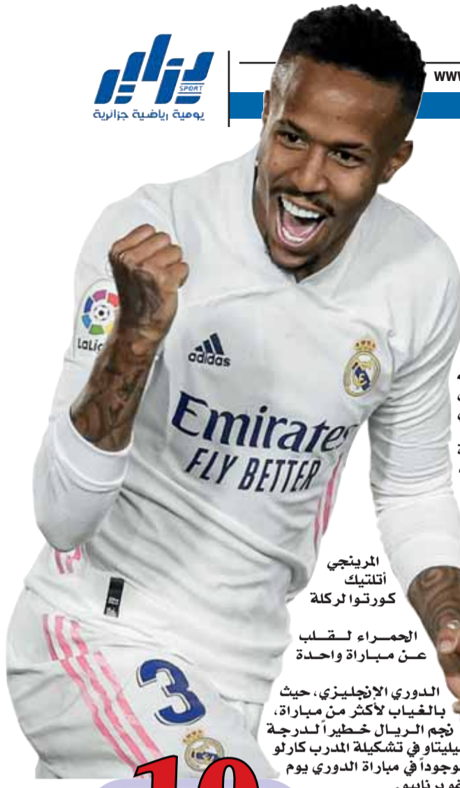
المريني أتلتيك كورتوا لركلة