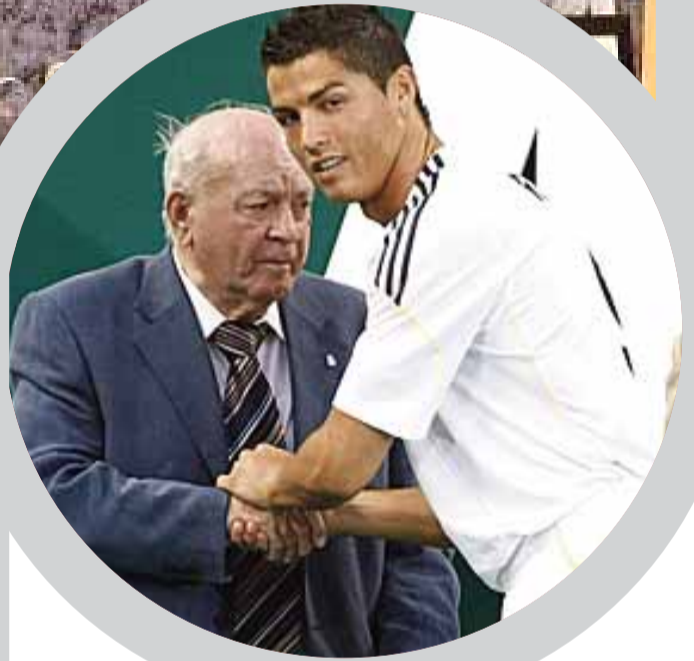
ألفريدو دي ستيفانو، كان لاعب كرة قدم، ومدرباً