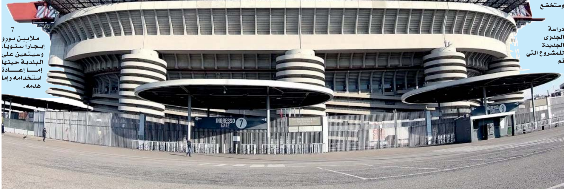
وستخضع دراسة الجدوى الجديدة للمشروع التي تم

تلقى مشروع عملاقي كرة القدم الإيطالية إنتر وجاره ميلان لبناء ملعب جديد مكان الملعب الحالي «سان سيرو» دفعة قوية، وذلك بعدما أفاد رئيس بلدية ميلانو بأنه يأمل في بيع الملعب للناديين بحلول الصيف المقبل. وفي حديثه لراديو «آر تي إل 102.5»، قال جوزيبي سالو إنه يأمل في تلقي دراسة جدوى رسمية، الثلاثاء، بما في ذلك عرض شراء من الناديين، على أن ينتقل بعد ذلك إلى مجلس بلدية المدينة. وأضاف: «الهدف هو بيع الملعب والمنطقة المحيطة به بحلول بداية العطلة الصيفية». ولطالما رغب عملاقا ميلانو في استبدال منطقة حديثة بسان سيرو، الحالي، وفي أكتوبر أعادا إطلاق مشروع مشترك تم التخلي عنه في عام 2023 بعدما أمضى أكثر من 3 أعوام في أروقة البيروقراطية.