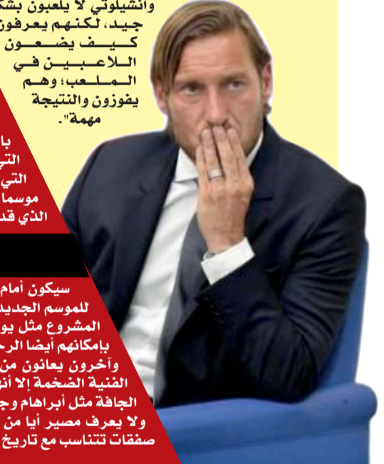
كيف يضعون اللاعبين في الملعب؛ وهم يفوزون والنتيجة مهمة.

سيكون أمام إدارة ميلان مهمة أخرى فيما يتعلق بالفريق، وهي عملية بناء قوي وتنافسي للموسم الجديد 2025-2026. فهناك لاعبين انتهى بهم الحال - لأسباب مختلفة - على هامش المشروع مثل يوفيتش وتشوكويزي وتيراشيانو وفلورينزي، بينما هناك لاعبين بقوا لكن بإمكانهم أيضاً الرجوع مثل توموري وإيمرسون رويال. وآخرون يعانون من مشاكل فنية مثل ثيو هيرنانديز ورافائيل لياو والذين رغم إمكاناتهم الفنية الضخمة إلا أنهم يعانون من مشاكل عديدة أثرت عليهما مؤخراً، إضافة إلى الإعاقات الجافة مثل أبراهام وجواو فيليكس. ولا يعرف مصير أي من المذكورين، ليدخل النادي صيف 2025 تحت ضغط كبير لإبرام صفقات تتناسب مع تاريخ النادي في محاولة لإعادته للواجهة مجدداً.