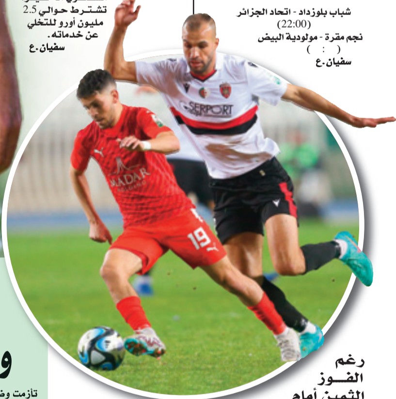
رغم الفوز الثمين أمام مولودية وهران