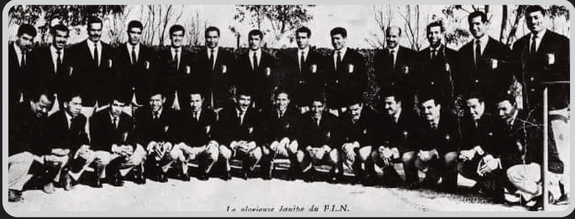
La gloireuse équipe du F.L.N.

بعد فريق جبهة التحرير الوطني لكرة القدم الذي تم تأسيسه بتاريخ 13 أبريل 1958 رمزا للرياضة الجزائرية، حيث اختار آنذاك لاعبون في أوج عطائهم الكروي تسخير شهرتهم لإسماع صوت الثورة التحريرية الجزائرية عبر أنحاء العالم. وبعد مرور 70 عاما على اندلاع ثورة الفاتح من نوفمبر 1954 المجيدة، فإن الشجاعة والروح الوطنية التي أظهرها هؤلاء اللاعبون الأسطوريون تبقى نموذجا للأجيال القادمة. وكانت بداية هذه الملحمة عندما قرر 32 لاعبا محترفا مغادرة أنديةهم الفرنسية، في سرية تامة، متوجهين إلى ماسيكون فيما بعد مقرهم الرئيسي، مدينة تونس، وذلك تحت قيادة الثنائي محمد بومرزاق ومحمد علام وشكلوا ما سيرفقه العالم ويكتشفه باسم فريق جبهة التحرير الوطني لكرة القدم. في 15 أبريل 1958، استيقظت فرنسا الاستعمارية على وقع صدمة اختفاء الضيق رشيد مخلوفي الذي كان صانع ألعاب نادي سانت إتيان وأحد صانعي تأهل المنتخب الفرنسي إلى نهائيات كأس العالم 1958 بالسويد، لتتبعه أسماء أخرى كبيرة كانت مضرة لأنديتها، على غرار اللاعبين الثلاثة لنادي موناكو، اللاعب الساحر مصطفى زيتوني والمهاجم قدور مخلوفي والحارس الكبير عبد الرحمن بوبكر وعمار روي (أنجييه) وعبد العزيز بن تيفور (نيس) وعبد الحميد كرمالي (أولمبيك ليون) ومحمد معوش الذي لعب لمعلم ريمس الكبير وغيرهم كثيرون.